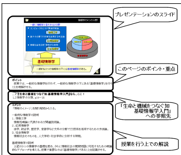
図2 「生命と機会をつなぐ授業」左側ページ

今月出版された西垣通監修「生命と機械をつなぐ授業」(高陵社書店)がアイテム2である。授業実践にもとづいた50分×10時間分の、プレゼンテーションとプリントである。内容は、基礎情報学をベースに、「情報社会に積極的に参画する態度」を考えさせる構成になっている。具体的には、各種言葉の定義、知覚や意識など脳科学分野の研究成果、コミュニケーションの成立条件とその影響、生物と機械の違い、システム論から捉えた心と社会、社会から個人への影響と個人から社会への影響などである。見開きで左側ページがプレゼンテーションのライドと授業解説(図2)、右側ページが穴埋め式の生徒用授業プリント(図3)で構成されている。すべて、本校において実践したものであり、そのまま授業で使用できるはずだ。なお、デジタルデータの公開に向けて準備中である。