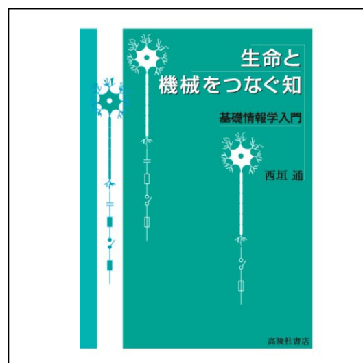
図1 「生命と機会をつなぐ知-基礎情報学入門-」

今年3月に出版された、西垣通著「生命と機械をつなぐ知-基礎情報学入門-」(高陵社書店)がアイテム1である。各節が理論と応用のセットになっており、3ページに1枚の割合でイラストが入るなど、内容を容易に理解できるように工夫されている。この一冊で、基礎情報学を理解すると同時に、「社会と情報」をどのようにデザインすべきであるか、を知ることができる。極めて効率の良い本である。